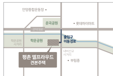
견본주택 _ 경기 안양시 동안구 비산동 1100-1